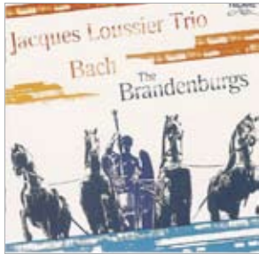
Jacques Loussier, Bach Brandenburg 179:- Best nr 4108

Till mina särskilda favoriter hör Jacques Loussier, pianisten som förenar intim triojazz med teman från den klassiska musiken. Hans