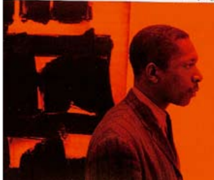
John Coltrane "The complete mainstream 1958 sessions" (2 CD) 179:- Best nr 4102

E F F P H, Rhodamagnetics (2 tagn), Snuffy, Countdown (2 tagn) B.J. (3 tagn), Anedac, Once In A While, Dial Africa, Oomba och Tanganyika Strut.