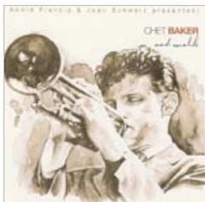
Chet Baker "Sad Walk" 149:- Best nr 4107

En annan fin platta är Chet Baker samlingen som heter Sad Walk – två cd – och som ingår i Harmonia Mundis/Le Chant du Mondes nya kollektion