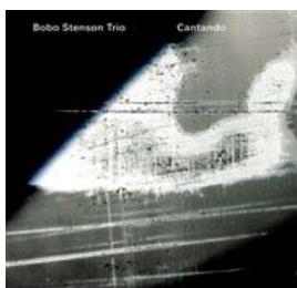
Bobo Stenson "Cantendo" 169:- Best nr 4255